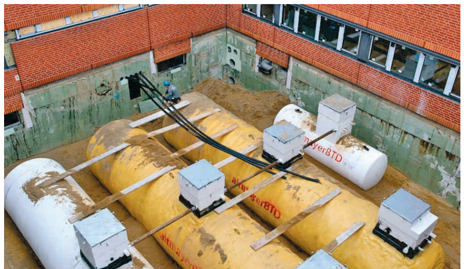
Die Tanks wurden mit einem 100-Tonnen-Kran über das 4-stöckige Gebäude hinweg in den Innenhof gehoben

Das Robert Koch-Institut ist ein Bundesinstitut im Geschäftsbereich des Bundesministeriums für Gesundheit. Dessen Kernaufgaben sind die Erkennung, Verhütung und Bekämpfung von Krankheiten, wie z. B. neue Formen der