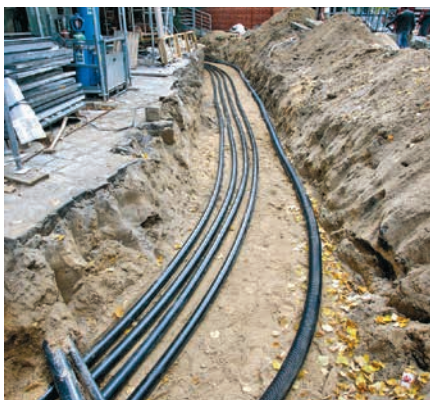
Durchgehende Verlegung ohne Verbindungsnähte vom Füllschacht bis zum Tank

längeren Zeitraum in seiner Energieversorgung autark sein und gerade dann seinen Dienst leisten können. Aufgrund der hohen Anforderungen wurde der Fokus auf Sicherheit und Funktionalität an oberster Stelle gesetzt. Bei der